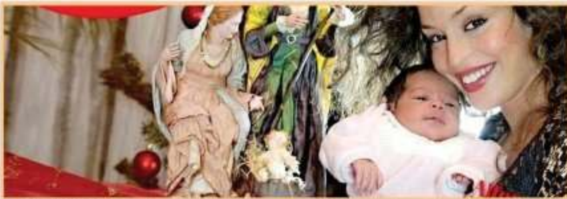
RAFFAELA Fico dengan bayinya yang diklaim sebagai anak dari Striker Manchester City, Mario Balotelli.